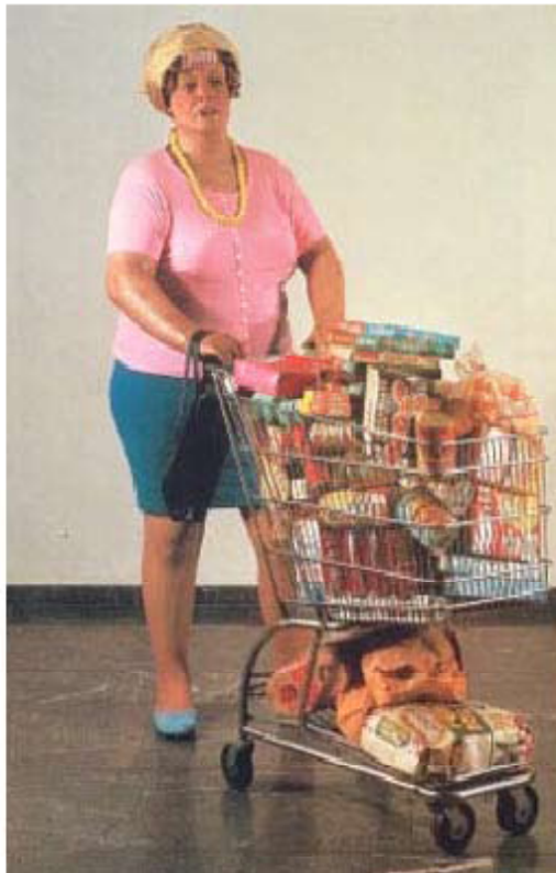
* Supermarket Lady by Duane Hanson

SCUOLA DEL DESIGN / POLITECNICO DI MILANO/BOVISA LABORATORIO DI METAPROGETTO / 2.L / sez.13 / a.a. 2011-2012